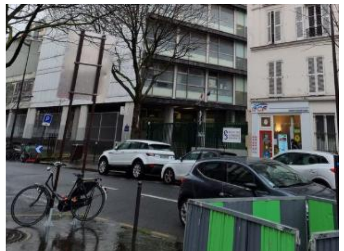
Faculté de médecine de Saint-Antoine